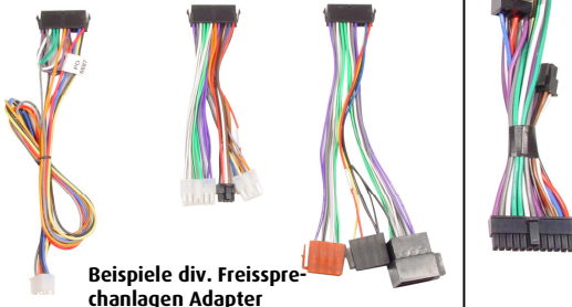
Beispiele div. Freisprechanlagen Adapter

Das vollständige Audio2Car Freisprechanlagen-Adapter Sortiment finden Sie auf unserer Internetseite: www.kram.dk