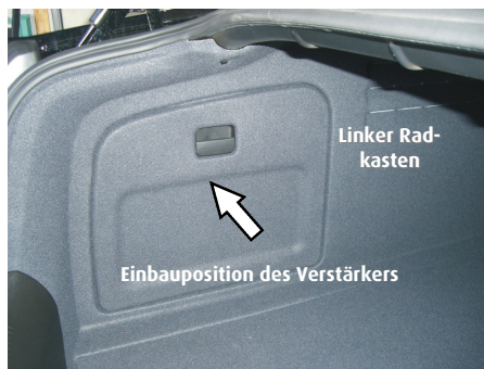
Verstärker Einbauposition in Audi A6 u. A6 Allroad