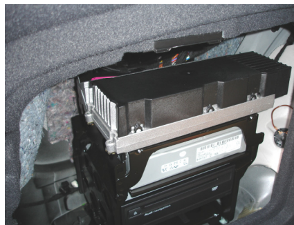
Foto: Verstärker im Modell ab 2006- . Kabelsatz 84063 ist richtig.

7. Freisprechanlagen-Adapter anschliessen. Freisprechanlagen-Adapter an Verlängerungskabel und Freisprechanlage anschliessen.